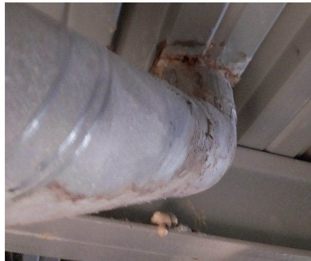
foto /1/ Pohled na 1. prostup dešťového svodu - fotografie z místního šetření provedeného dne 03. 10. 2024

• Při místním šetření provedeném dne 03. 10. 2024 nebyly zjištěny vážné statické poruchy, které by bránily provedení navrhovaných stavebních prací. V interiéru v oblasti prostupů dešťových svodů byla zjištěna 2 lokální místa s vlhkostní poruchou v interiéru.